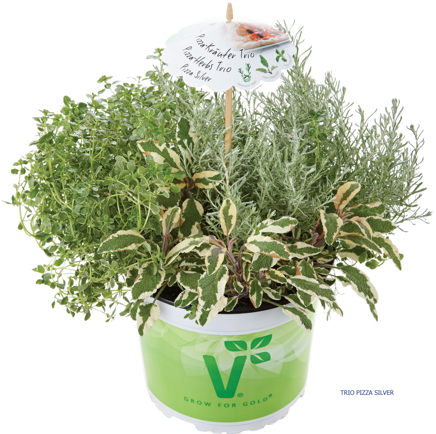
TRIO PIZZA SILVER