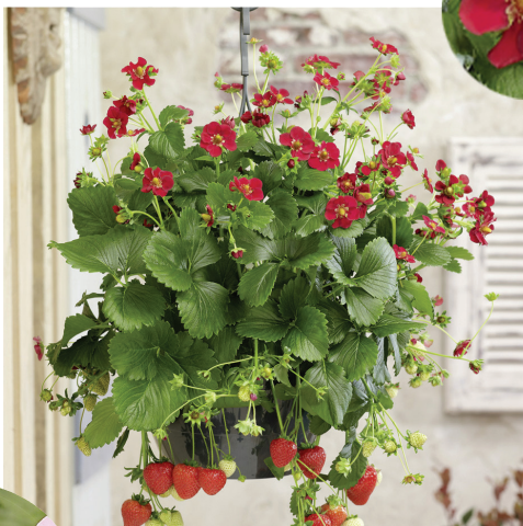
Fragaria ananassa 'ARIBA® RED'