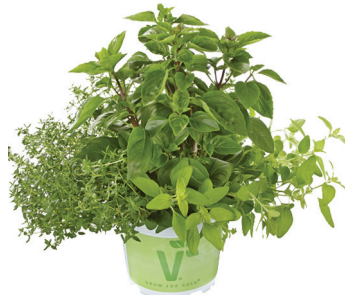
TRIO PASTA DELUXE

Trio de hierbas para hacer infusiones. Menta x piperita 'Multimenta', Lipia citriodora 'Freshman', Melissa officinalis 'Relax'.