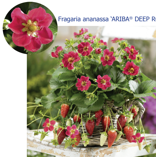
Fragaria ananassa 'ARIBA® DEEP ROSE'