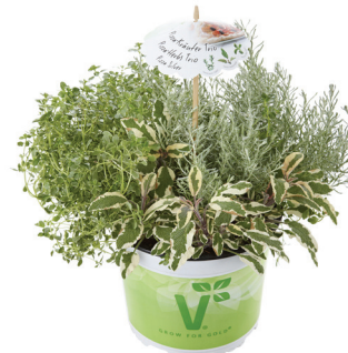
TRIO PIZZA SILVER

Trio de hierbas para hacer recetas de pizza. Rosmarinus officinalis 'Abraxas', Thymus vulgaris 'Fredo', Origanum vulgare 'Diabolo'.