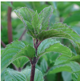
Menta x piperita 'MULTIMENTA'

Menta con un elevado contenido de mentol. Ideal para infusiones. Crecimiento vigoroso.