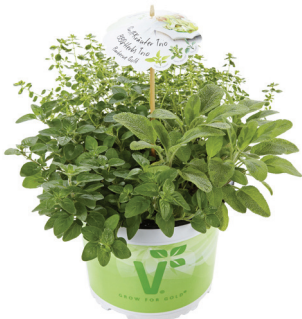
TRIO BBQ GOLD

Trio de hierbas para hacer recetas de pasta. Origanum vulgare 'Diabolo', Thymus vulgaris 'Fredo', Ocimum basilicum 'Tauris'.