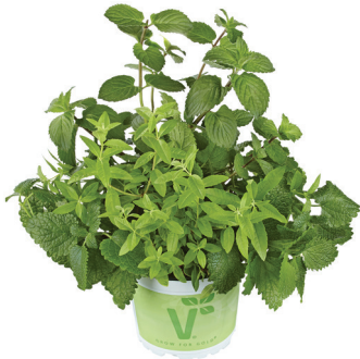
TRIO ICE TEA