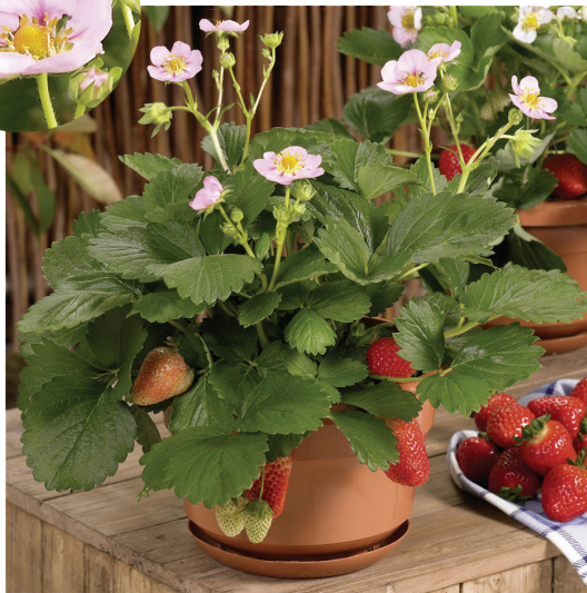
Fragaria ananassa 'ARIBA® ROSE'