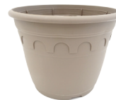
M14 DECOR DECOR